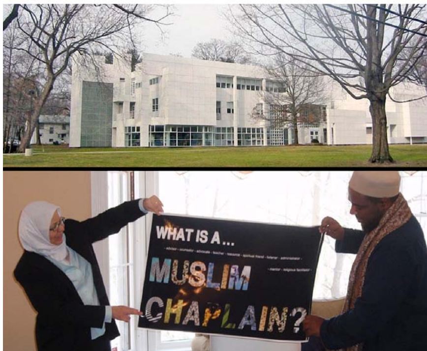
Ill. 5. Hartford Seminary today. Two Muslim chaplains.